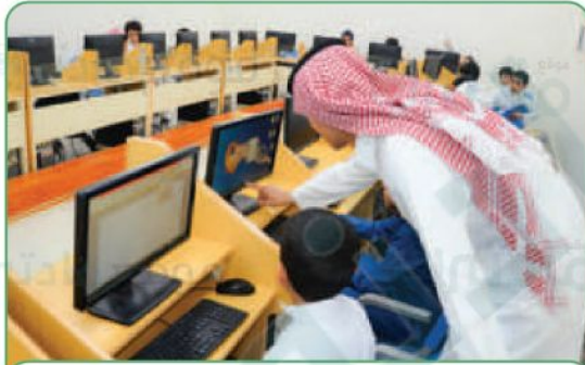
أحد الفصول الدراسية في المملكة العربية السعودية

يعتني برنامج تنمية القدرات البشرية بالطلبة منذ بدء مراحل تعليمهم المبكرة، وهذا يتطلب بذل الجهد والمثابرة والعمل الدؤوب من جانبهم؛ لتحقيق أهدافه، وإبراز مكانة المملكة العربية السعودية محلياً وعالمياً.