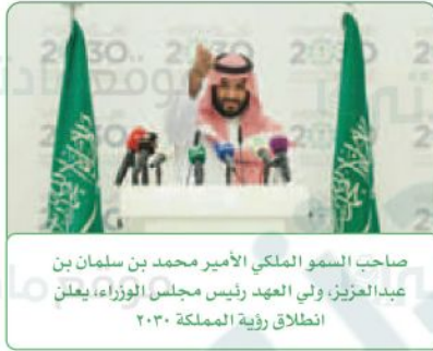
صاحب السمو الملكي الأمير محمد بن سلمان بن عبدالعزيز، ولي العهد رئيس مجلس الوزراء، يعلن انطلاق رؤية المملكة ٢٠٣٠

هي خطة مستقبلية للطموحات والأهداف التي نريد تحقيقها.