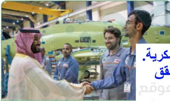
لكي ولي العهد يشجع عدداً من الشباب السعوديين الذين قاموا بتجميع أول طائرة عسكرية وتصنيع عدد من أجزائها عام ١٤٤٠هـ

أ- يطلع الطلبة على الصورة ويصفون الإنجاز الذي حققه الشباب السعودي وعلاقته برؤية المملكة ٢٠٣٠.