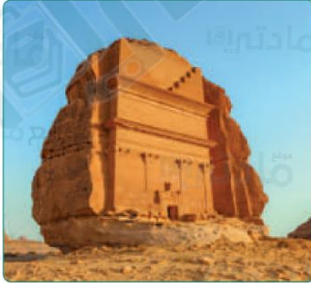
قصر الفريد بمنطقة الحجر