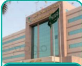
مدينة الملك عبدالله الطبية بمكة المكرمة