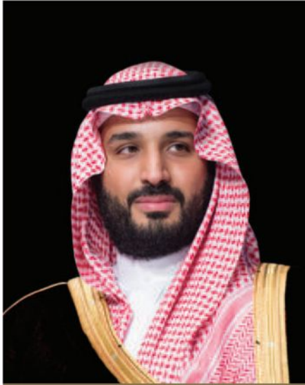
صاحب السمو الملكي الأمير محمد بن سلمان بن عبدالعزيز آل سعود ولي العهد، رئيس مجلس الوزراء