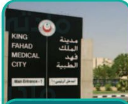
مدينة الملك فهد الطبية بالرياض