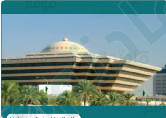
وزارة الداخلية (مؤسسة عامة)