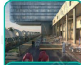
مدينة الملك فيصل الطبية في عسير