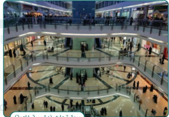
سوق تجاري (مؤسسة خاصة)