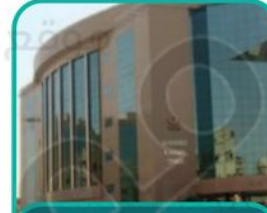
مدينة الملك سعود الطبية بالرياض