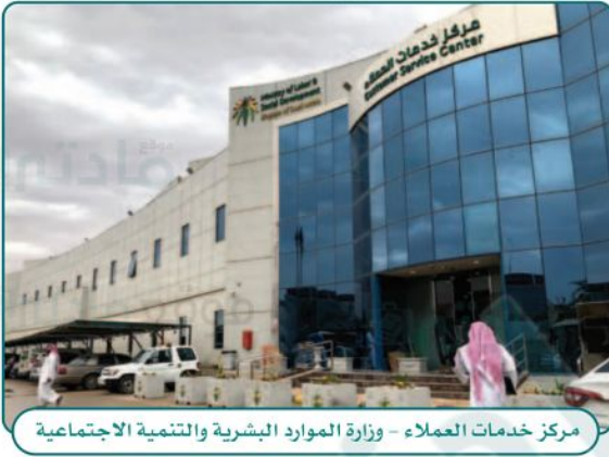
مركز خدمات العملاء - وزارة الموارد البشرية والتنمية الاجتماعية