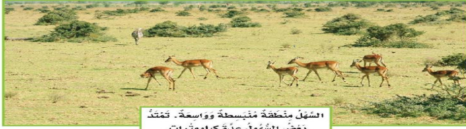
السَّهْلُ مَنْطِقَةٌ مَبْسُطَةٌ وَوَأَسَعَةٌ . تَمْتَدُّ بَعْضُ السُّهُولِ عِدَّةَ كِيلُومِتْرَاتٍ .

* اليابسة التي نعيش عليها لها أشكالٌ مختلفةٌ ؛ فقد تكونُ سهولاً مُبسطةً ، أو ودياناً مُخفِضةً ، أو جبلاً وتلالاً مُرتفعةً .