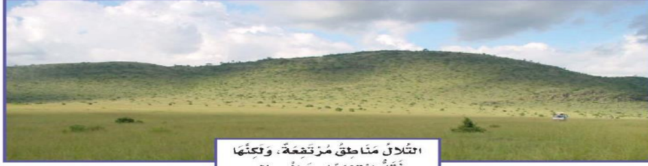
السَّالَى مَنْطِقٌ مُزْتَجِعَةٌ ، وَتَكُنُّهَا أَقْلُ ارْتِخَاعًا مِنَ الْجِبَالِ .