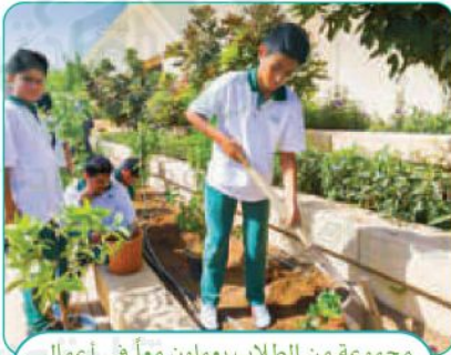
مجموعة من الطلاب يعملون معاً في أعمال تشجير المدرسة