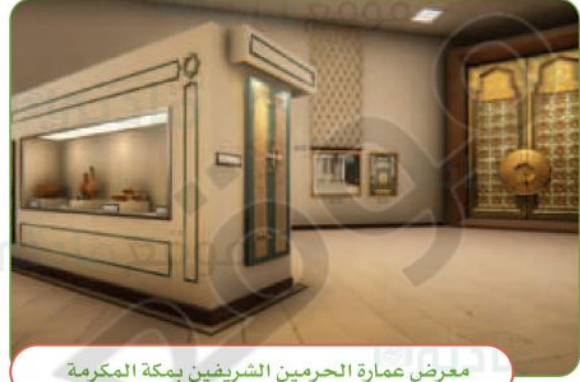
معرض عمارة الحرمين الشريفين بمكة المكرمة

أحافظ على الآثار في وطني المملكة العربية السعودية بتجنب التعدي عليها أو العبث بها، وإذا وجدت شيئاً منها أسلمه للجهة المسؤولة عن الآثار في وطني، وهذا دليل على محبتي لوطني وتقديري لتاريخه العريق.