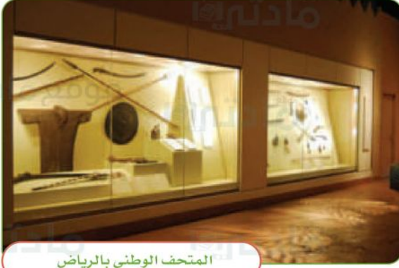
المتحف الوطني بالرياض

في وطني متاحف تضم أبرز القطع الأثرية وصوراً لمعالم تاريخية وثقافية من وطني. كما تقام بين حين وآخر معارض تبرز العناية الكبيرة فيما يقدمه وطني من أعمال وإنجازات.