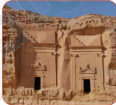
الحِجْر في العُلا