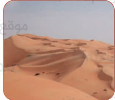
الأحفاف (مطمورة) في الربع الخالي