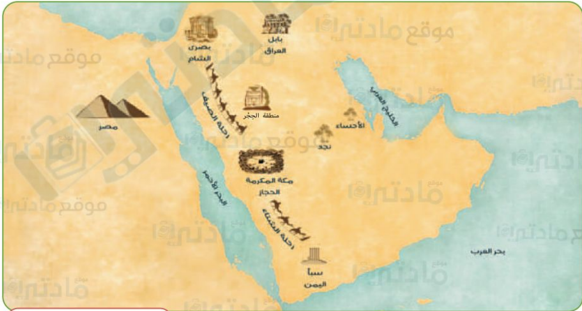
شبه الجزيرة العربية قديماً

قال الله عز وجل: ﴿لَإِيْلَفٍ قُرَيْشٍ ۝١ إِيْلَفُهُمْ رِحْلَةَ الشِّتَاءِ وَالصَّيْفِ ۝٢﴾ [قريش].