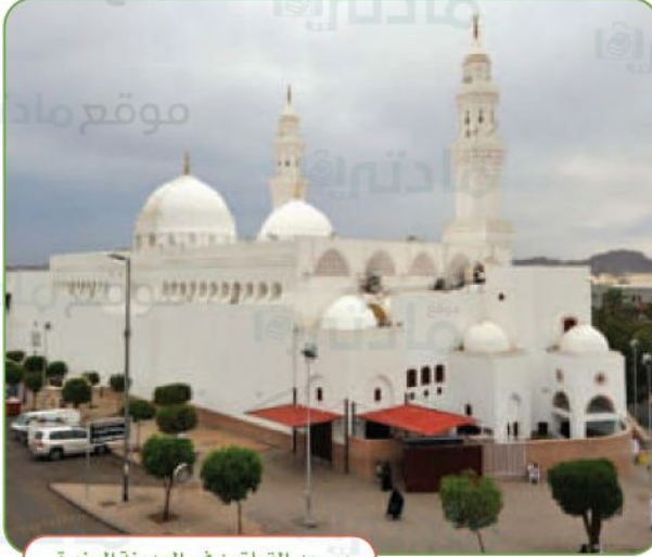
مسجد القبلتين في المدينة المنورة