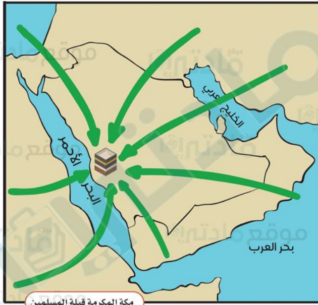
مكة المكرمة قبلة المسلمين

نعتز ونفتخر بأن وطننا المملكة العربية السعودية هو قبلة المسلمين ، وفيه المدينتان المقدستان :