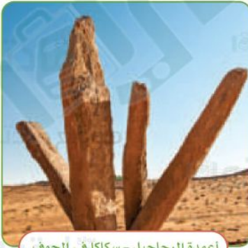
أعمدة الرجاجيل - سكاكا في الجوف

◆ دلمون على ساحل الخليج العربي، ومكانها القطيف في المنطقة الشرقية.