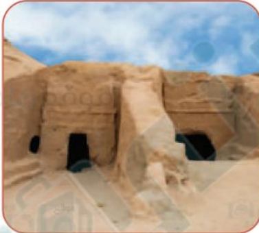
مغارات شعيب في منطقة تبوك