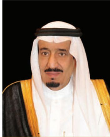
خادم الحرمين الشريفين الملك سلمان بن عبدالعزيز آل سعود ملك المملكة العربية السعودية