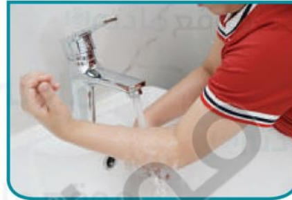
محافظة في استهلاك الماء