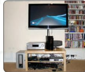
٣ عدم قفل الألعاب الإلكترونية بعد الانتهاء منها