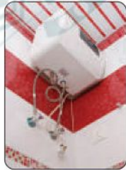
٤ فصل الكهرباء عن السخان في حالة عدم استخدامه