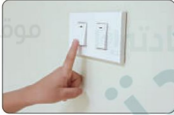
٢ قفل الإضاءة والتكييف عند عدم الحاجة إليها