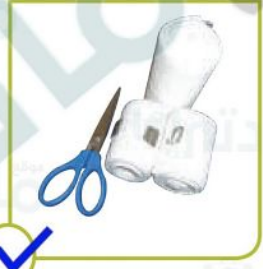
مقص ورباط ضاغط