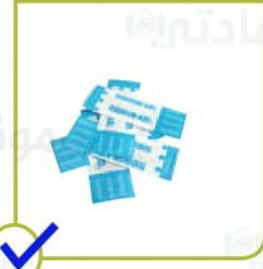
لاصق جروح وشيش